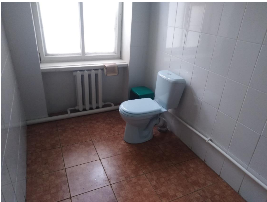
Фото 12 Туалетная комната