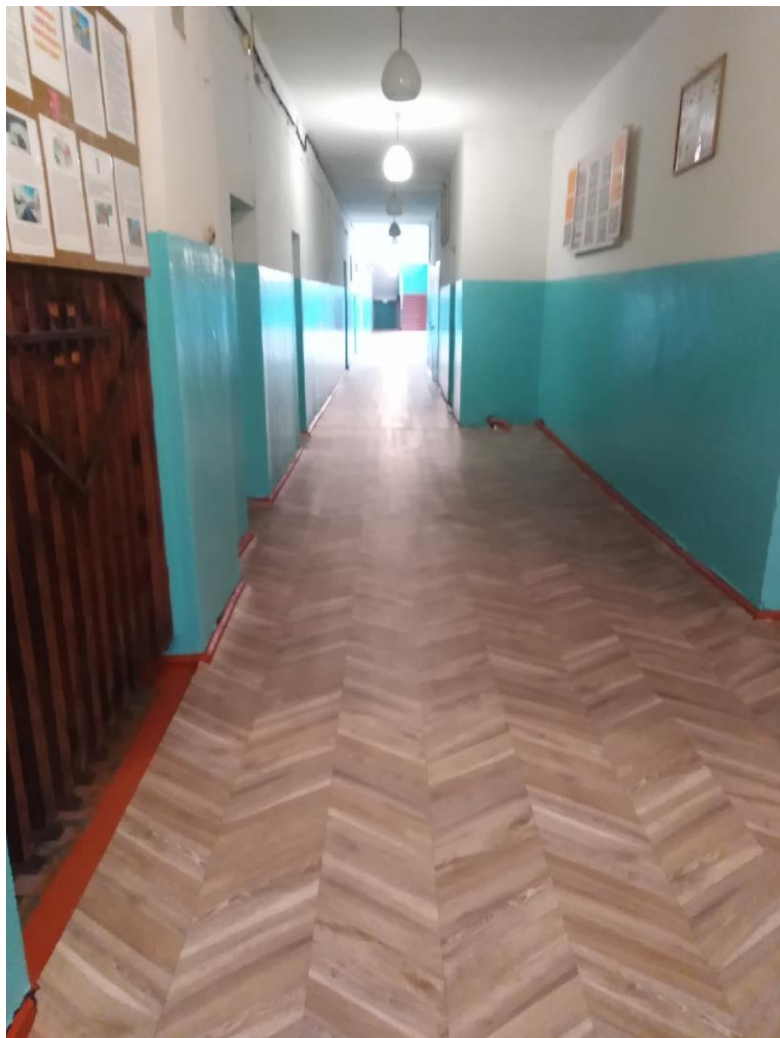
Фото 8 Коридор