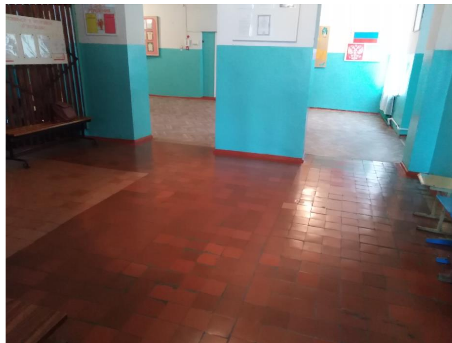
Фото 7 Вестибюль