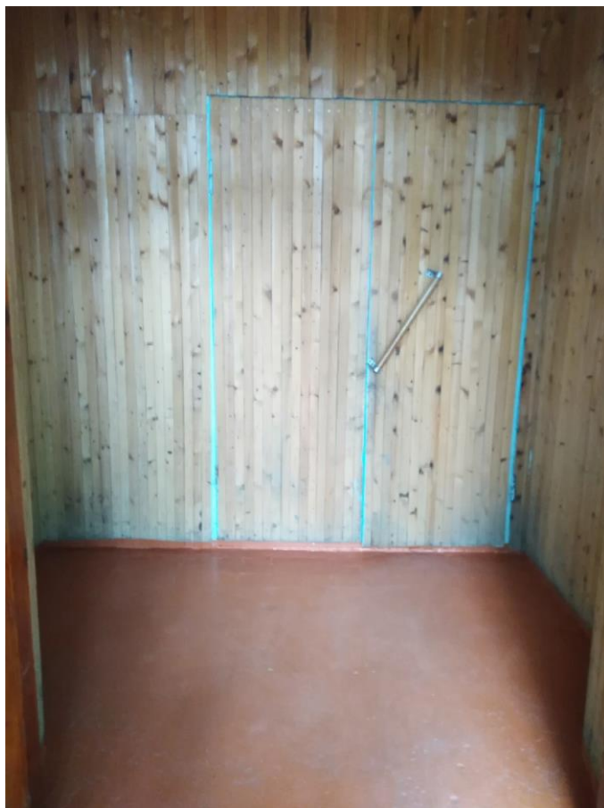
Фото 6 Тамбур