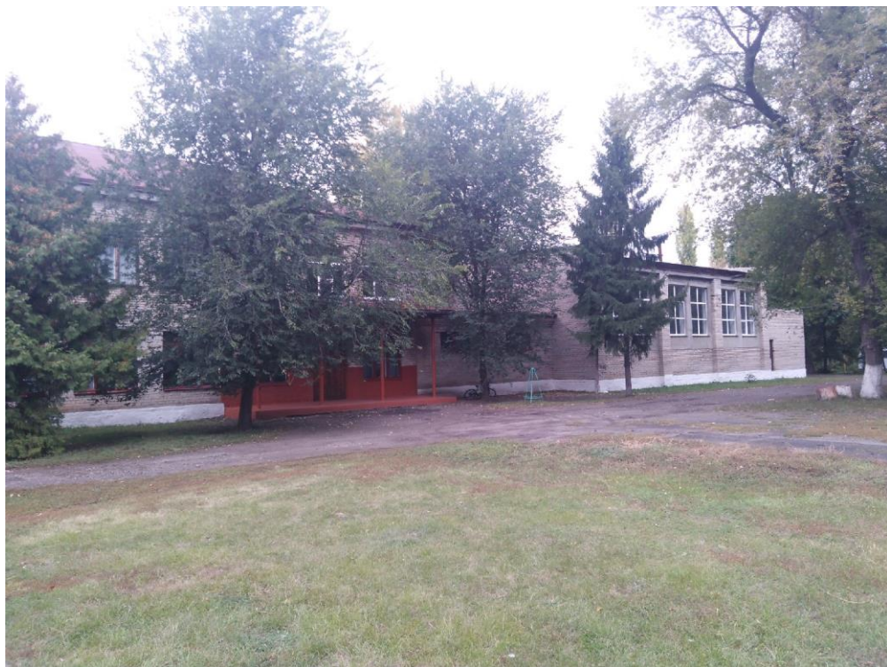
Фото 14 Визуальные средства