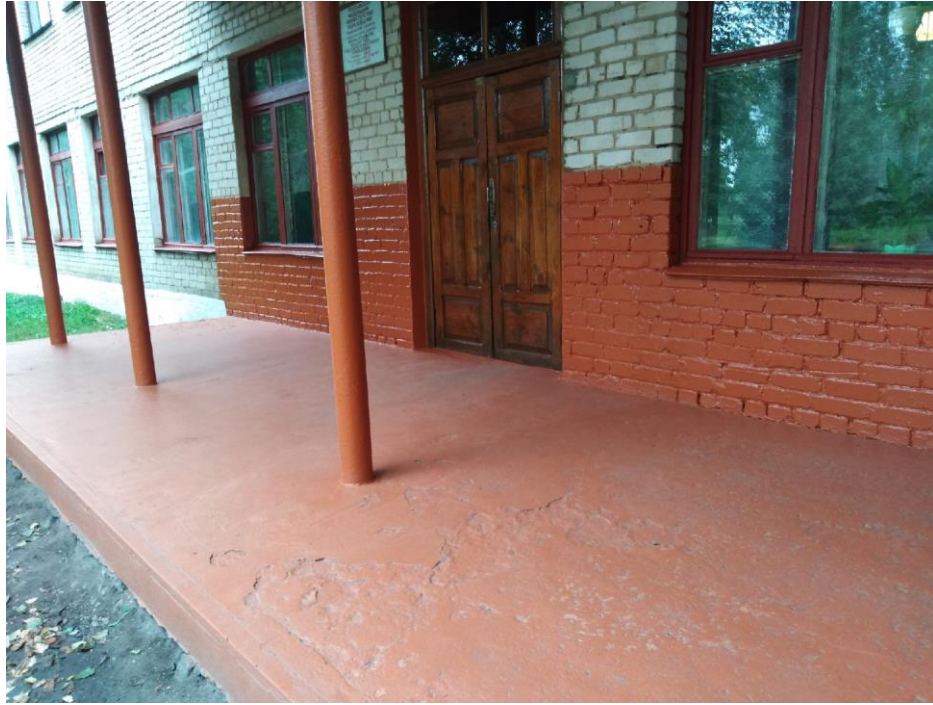
Фото 4 Входная площадка