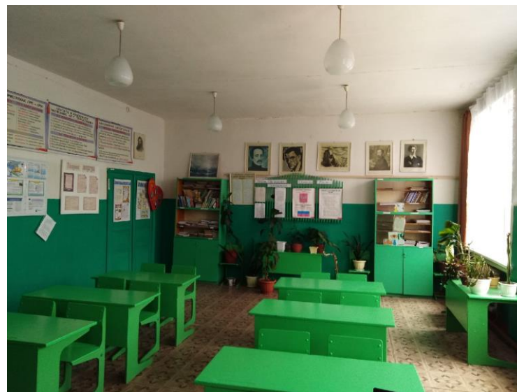
Фото 11 Классный кабинет