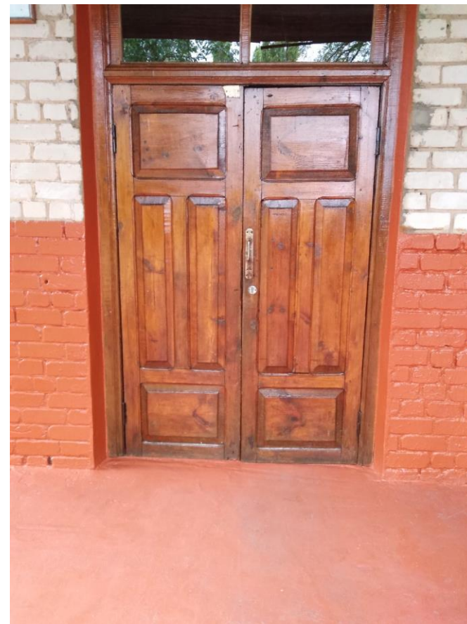
Фото 4 и 5 Входная дверь