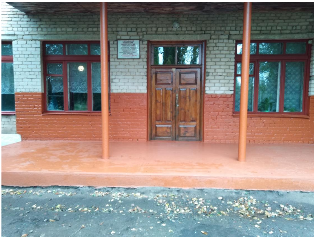
Фото 3 Лестница (наружная)