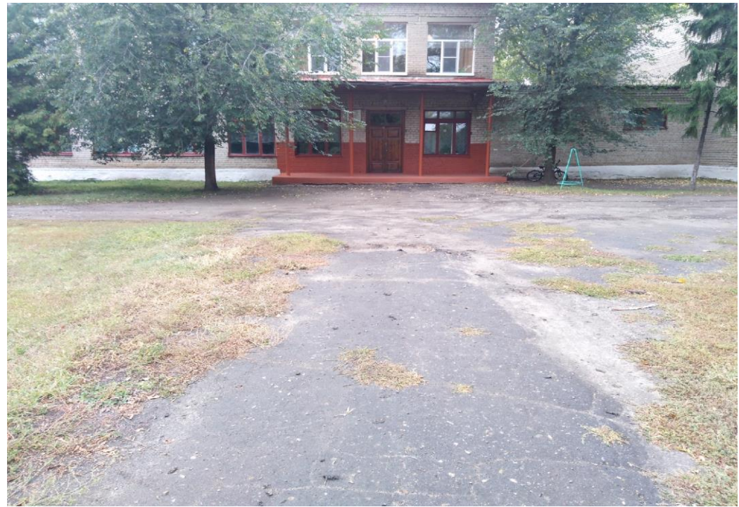
Фото 2 Путь движения на территории