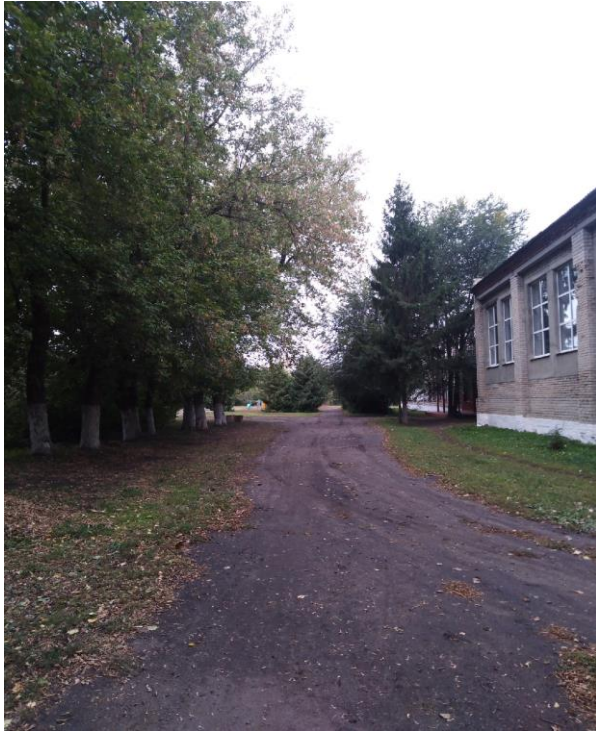
Фото 1 Вход на территорию