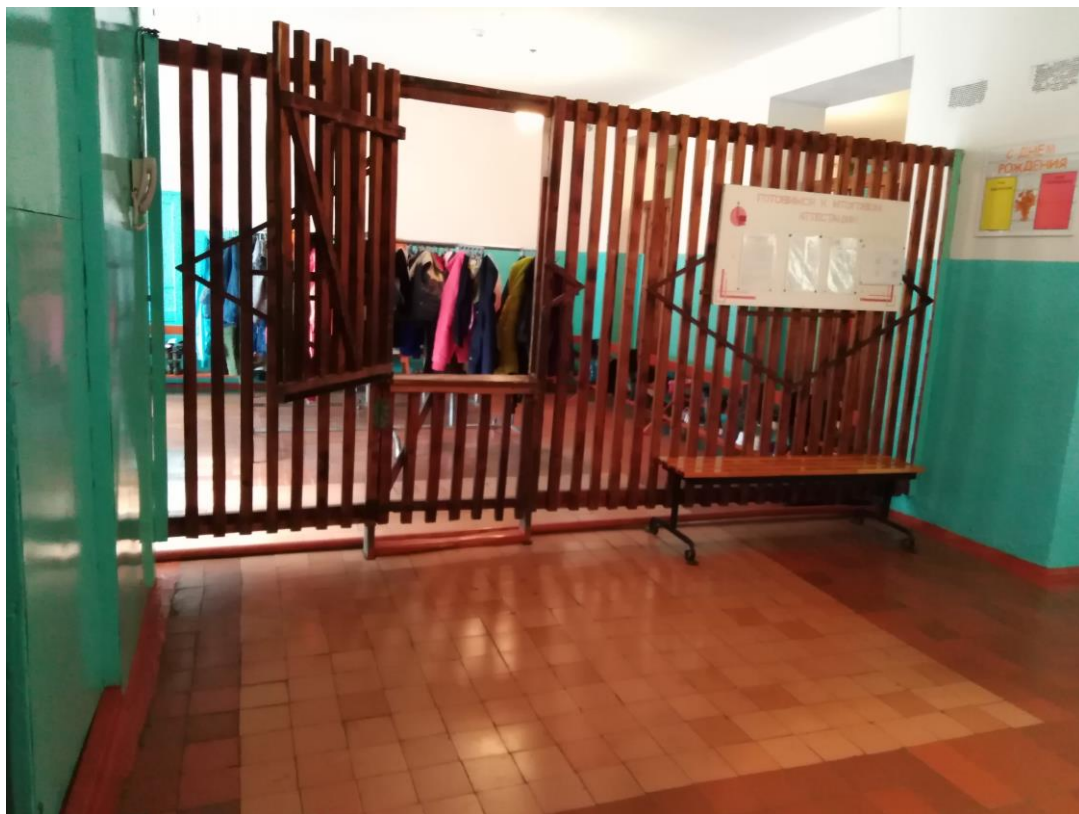
Фото 13 Гардеробная