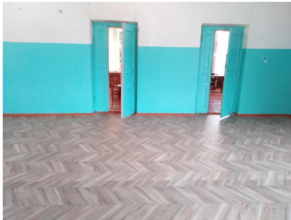
Фото 9 Учебные кабинеты