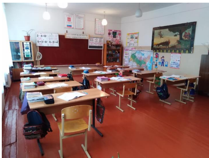
Фото 10 Классный кабинет